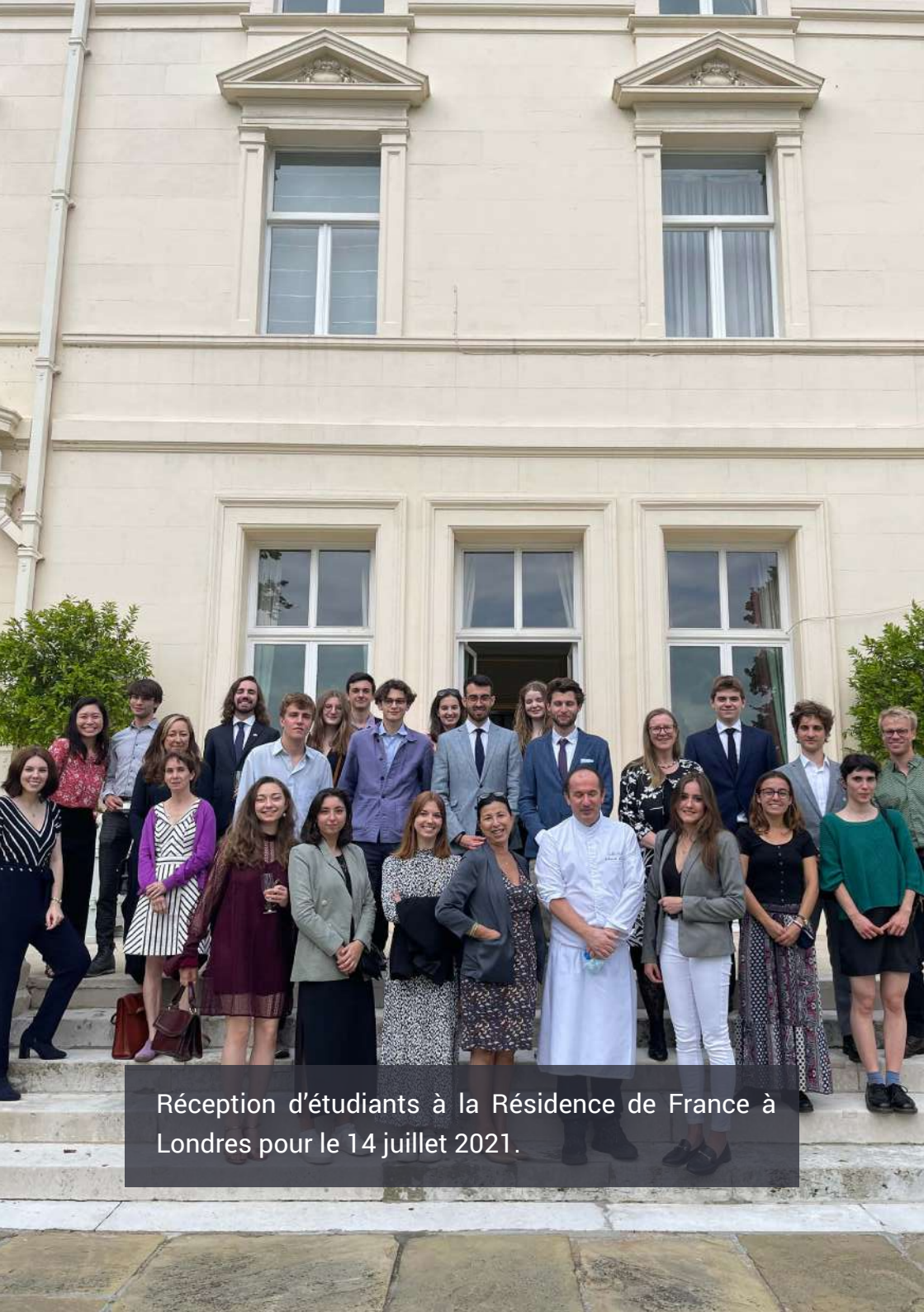
Réception d'étudiants à la Résidence de France à Londres pour le 14 juillet 2021.