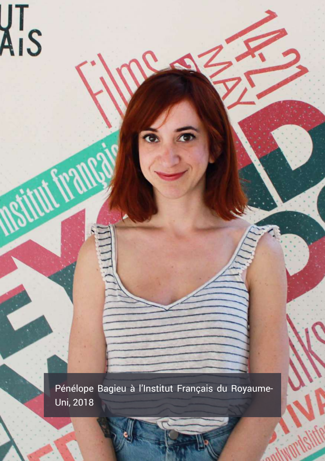
Pénélope Bagieu à l'Institut Français du Royaume-Uni, 2018