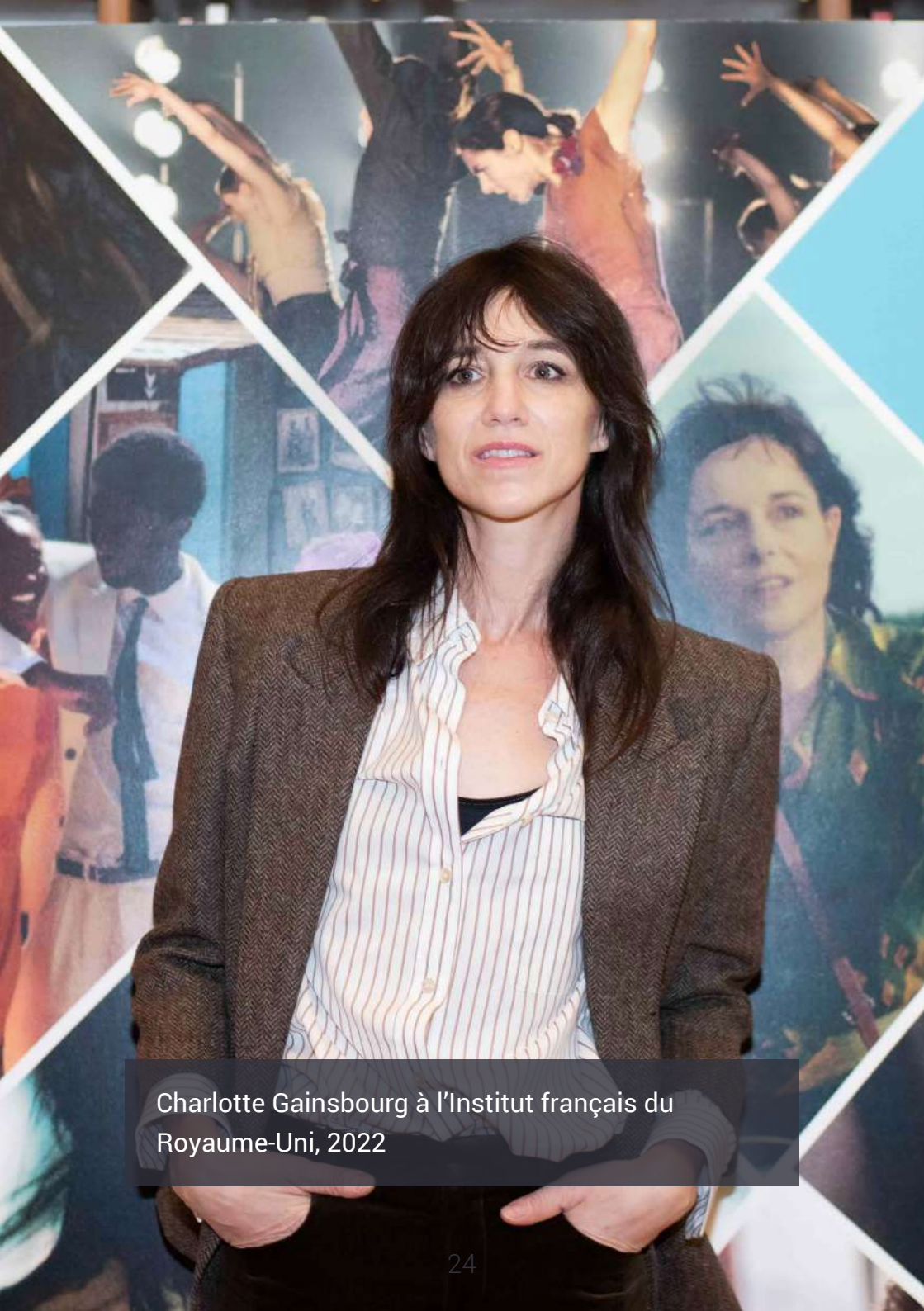
Charlotte Gainsbourg à l'Institut français du Royaume-Uni, 2022